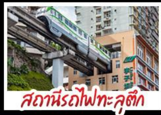
สถานีรถไฟทะเลสาบ

ลงชิง - อุโมงค์ - หงหยาดัง อุทยานเขานางฟ้าลงชิง สถานีรถไฟทะเลสาบ หมู่บ้านสามสะพานสวรรค์