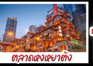
ตลาดเขงเขงชาติ