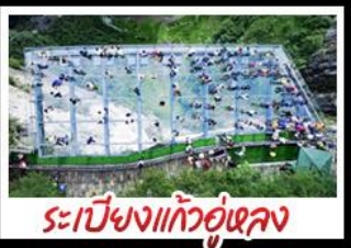
ระเบียงแก้วอยู่เฉย