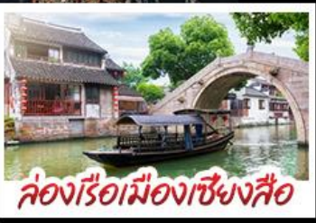
คลองเรือเมืองเซียงซือ