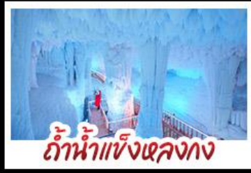
ถ้ำน้ำแข็งหลงกวง

เมืองกุ้ยหยางทุ่งดอกมีสตา์ดและดอกซากุระ ชมเมืองโบราณไท่ผิง - น้ำตกตึกเตี้ยน เมืองโบราณเซียงซือ - กำแพงหลงกวง อิสระช้อปปิ้งถนนตงซีเซียง ถนนซีเจียง ยอดเขาชิงชิว - รถไฟความเร็วสูง เมนูพิเศษ บุฟเฟ่ต์ย่างบาร์บีคิวอาหารเวียดนาม อาหารกลางวัน