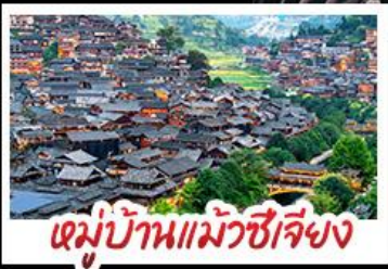
หมู่บ้านแม้วซีเจียง