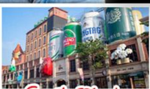
โรงแรมเป่ย์ชิ่งเต่า