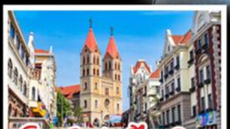
โบสถ์เซนต์ไมเคิล