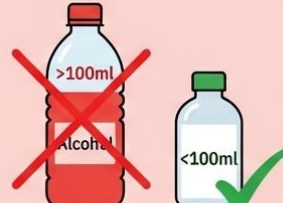
ของเหลว/แอลกอฮอล์เกิน 100 มิลลิลิตร