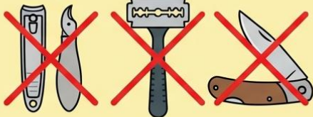
กรรไกรตัดเล็บ (Nail Clippers) มีดโกน (Razor) มีดพับ (Folding Knife)