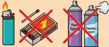
ไฟแช็ก, ไม้ขีดไฟ (Lighter, Matches) สเปรย์หรือกระป๋องอัดแก๊สทุกชนิด