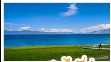
ทะเลสาบไซลีมู

หุบเขาดอกท้อ - ทะเลสาบไซลีมู แกรนด์แคนยอนตู่ชานจื่อ - ทุ่งหญ้าทิเบต