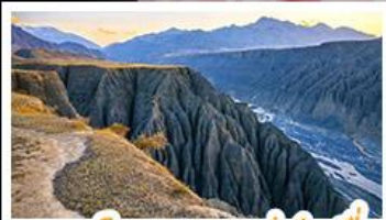
แกรนด์แคนยอนตู่ชานจื่อ