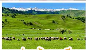
ทุ่งหญ้าทิเบต