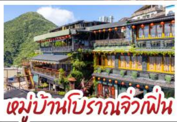
หมู่บ้านปิรามิดจิ๋วฝิ่น