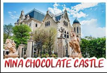
NINA CHOCOLATE CASTLE

ทะเลสาบสุริยจันทราร - ไทเป 101 จิวเฟิน - NINA CHOCOLATE CASTLE MONSTER VILLAGE - ซีเหมินติง เมนูพิเศษ ปลาประจานาธิบดี เซี่ยวหลงเปา / ชาบูไต้หวัน