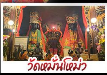
วัดเซมันไต้เม่ว