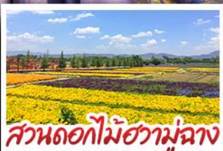
สวนดอกไม้ฮวาหู่