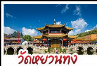
วัดเขวหนาทง

ถนนสายสีม่วงดอกศรีตรังและลาเวนเดอร์ หุบเขาพระจันทร์สีน้ำเงิน - ภูเขาหิมะมังกรหยก เมืองโบราณลี่เจียง - สวนดอกไม้ฮวาหู่ รถไฟความเร็วสูง - วัดหยวนทง - รถไฟความเร็วสูง พักโรงแรมระดับ 4 ดาว - KUNMING OLD STREET เมนูพิเศษ สุกี้ปลาเซลมอน สุกี้หัด อาหารกวางตุ้ง