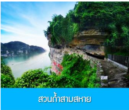
ส่วนท่าสามสหาย