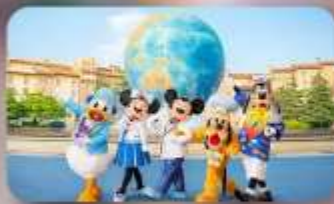
อิสระตามอริยาซึย 2 วัน