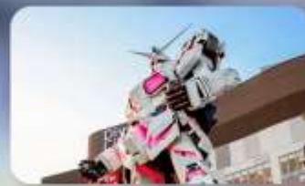
ช้อปปิงโอไดบะ