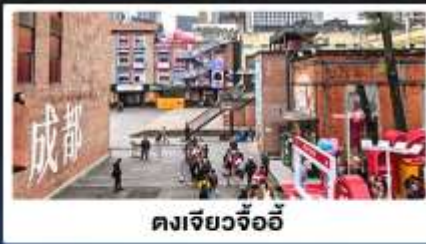
ตงเจียวจ้ออี้