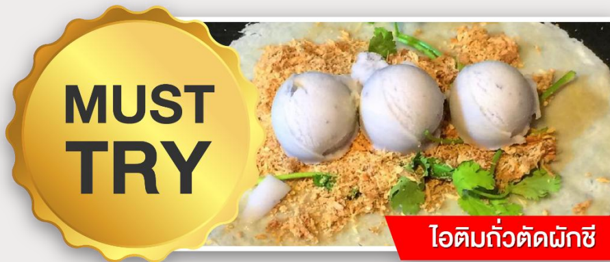
ไอติมแก้วตัดผักชี

นำท่านเดินทางกลับสู่ กรุงไทเป (TAIPEI CITY) ให้ท่านพักผ่อนและชมวิวทิวทัศน์สองข้างทางบนรถ (ใช้เวลาเดินทางประมาณ 1 ชั่วโมง)