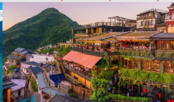
ถนนโบราณจิวเฟิ่น