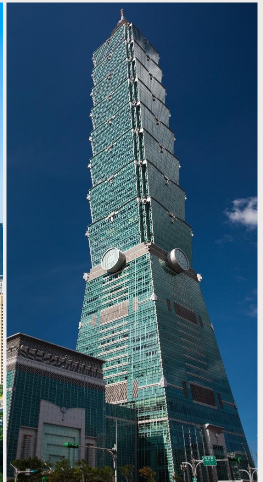
ตึกไทเป 101 (Taipei 101)