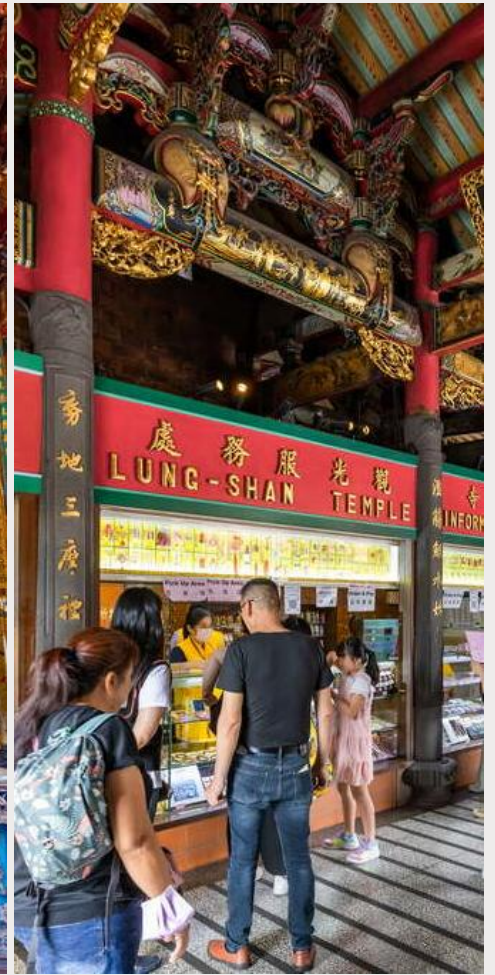
วัดหลงซาน (Longshan Temple)

กลางวัน บริการอาหารกลางวัน ณ ภัตตาคาร (เมนูพิเศษ บุฟเฟ่ต์ชาบู)