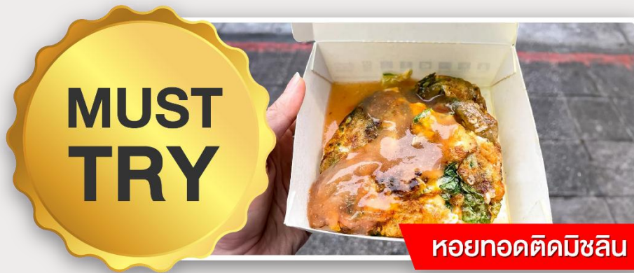
หอยทอดตัดมิชลิน

อิสระอาหารเย็นตามอัธยาศัย ณ ตลาดกลางคืนหนิงเซี่ย