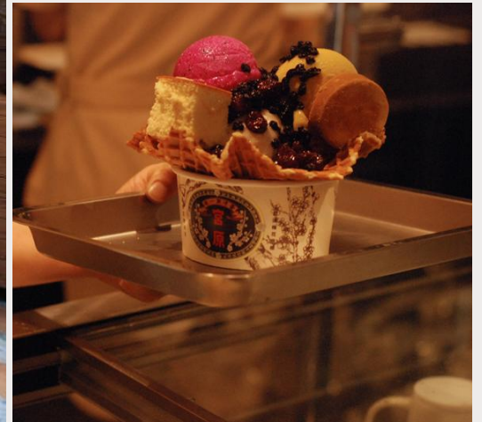
ร้านไอศกรีมมิยาฮาระ (Miyahara Ice cream)

นำท่านเดินทางสู่ ตลาดกลางคืนอี้จง (Yizhong Street Night Market) ที่นี้มีทั้งร้านอาหาร ของกิน ร้านเสื้อผ้า ร้านรองเท้า รวมไปถึงห้างสรรพสินค้า มีแต่ของกินของชื้อที่ไ้หวันเยอะแยะมากมาย ให้ท่านได้เลือกชื้อปเลือกชื้อกันได้ตามอัธยาศัย