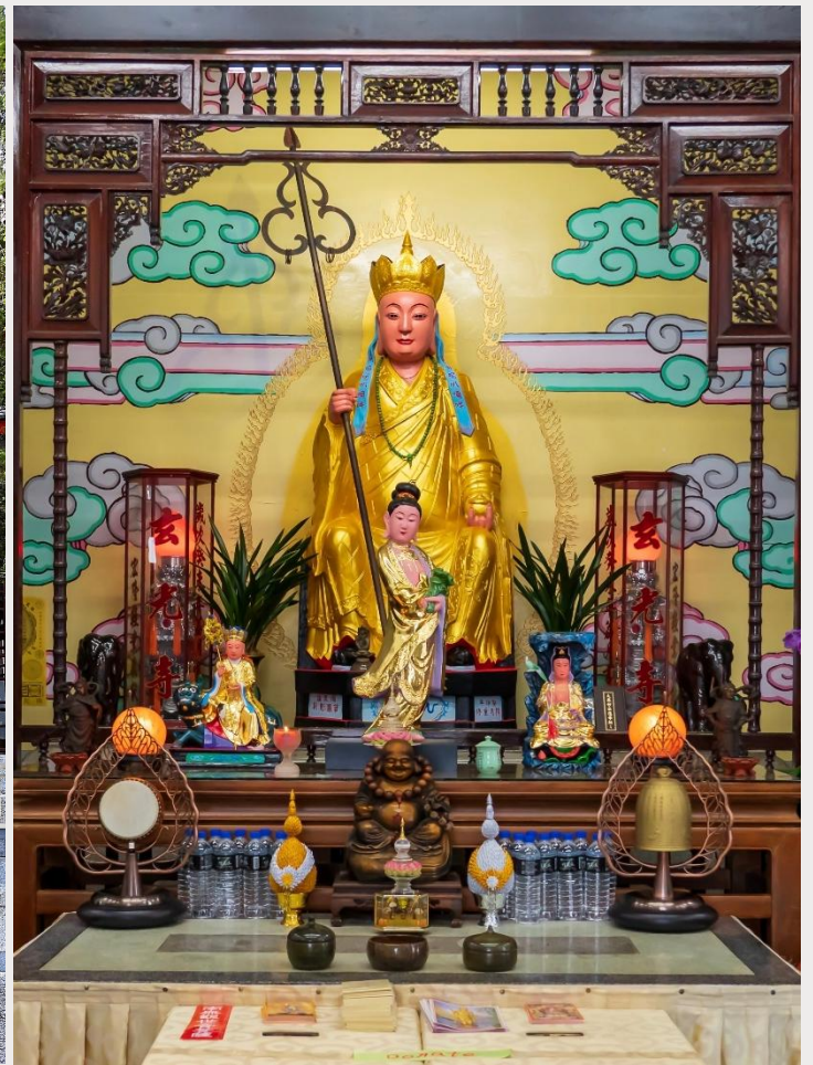
วัดพระถังซัมจั๋ง (Xuanguang Temple)

นำท่านเดินทางสู่ กรุงไทเป (TAIPEI CITY) เมืองหลวงของไต้หวัน ศูนย์กลางทางการเมือง การปกครอง เศรษฐกิจ การค้า และวัฒนธรรมที่หลากหลาย มีประชากรประมาณ 2.6 ล้านคน กรุงไทเปถูกสร้างขึ้นตั้งแต่ปลายศตวรรษที่ 19 สมัยราชวงศ์ชิง มีอายุกว่า 130 ปีมาแล้ว แต่ยังคงรักษาไว้ซึ่งวัฒนธรรมอันเก่าแก่ อย่างเช่น โบราณสถาน ถนนสายเก่า และวัดวาอาราม ที่มีคุณค่าทางประวัติศาสตร์อยู่มากมาย ปัจจุบันไทเปเป็นหนึ่งในเมืองขนาดใหญ่ในทวีปเอเชียที่มีย่านการค้าที่มีชื่อเสียง มีอาหารนานาชาติ บรรยากาศยามค่ำคืนที่คึกคัก และระบบคมนาคมขนส่งสาธารณะที่มีประสิทธิภาพ รวมถึงเป็นที่ตั้งของตึก Taipei 101 ซึ่งเคยเป็นตึกที่สูงที่สุดในโลก และมีสถานที่ท่องเที่ยว ทั้งทางธรรมชาติและวัฒนธรรมอีกมากมาย (ใช้เวลาเดินทางประมาณ 3 ชั่วโมง 30 นาที)