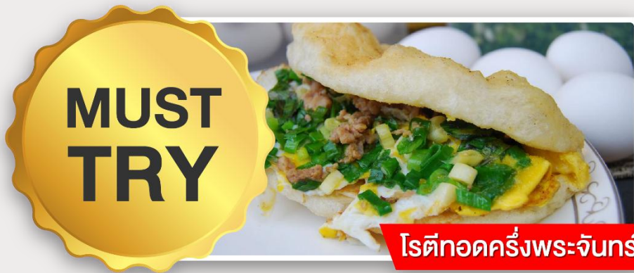
โรตีกอดครึ่งพระจันทร์

อิสระอาหารเย็นตามอัธยาศัย ณ ตลาดกลางคืนอิง