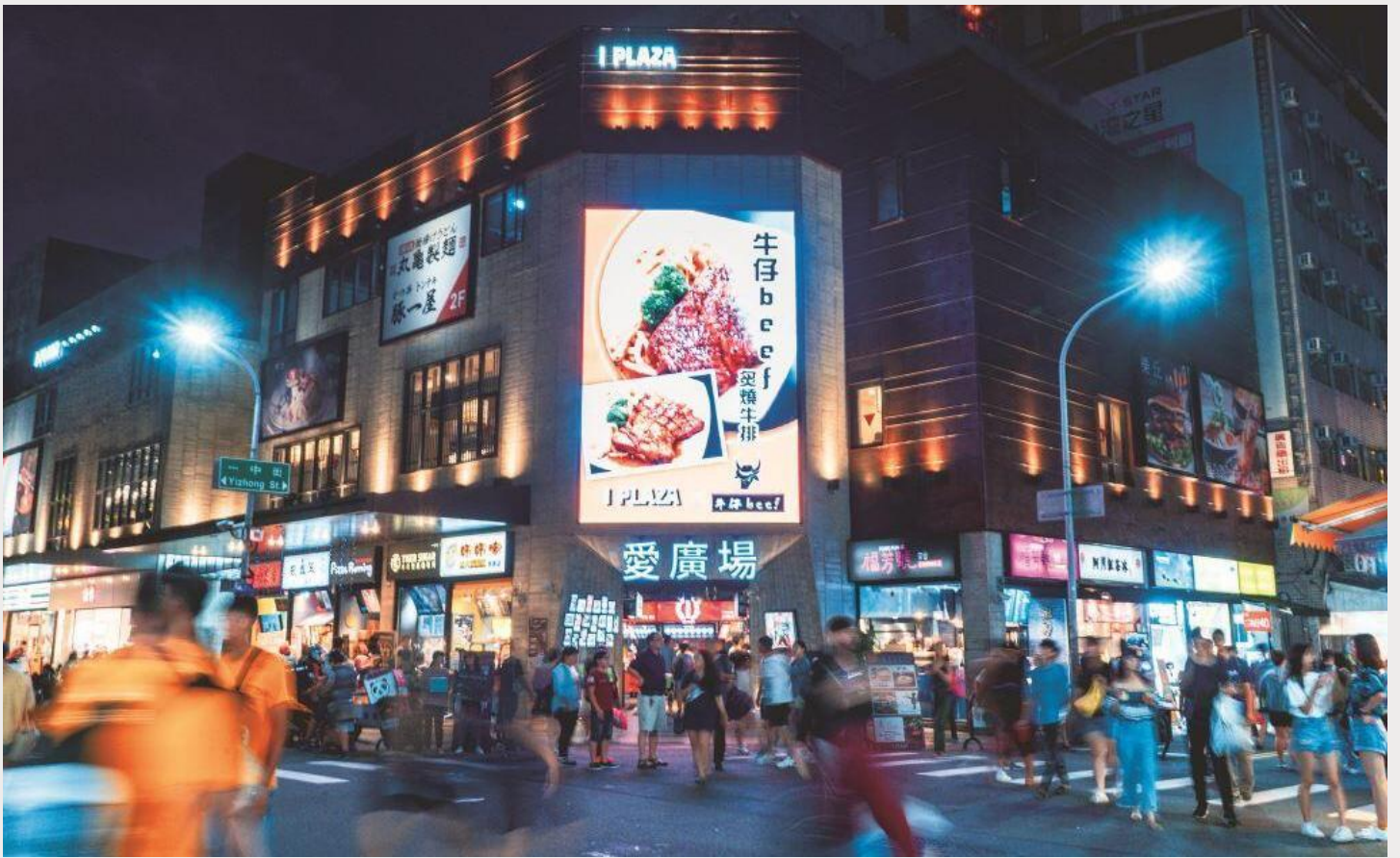
ตลาดกลางคืนอิง (Yizhong Street Night Market)