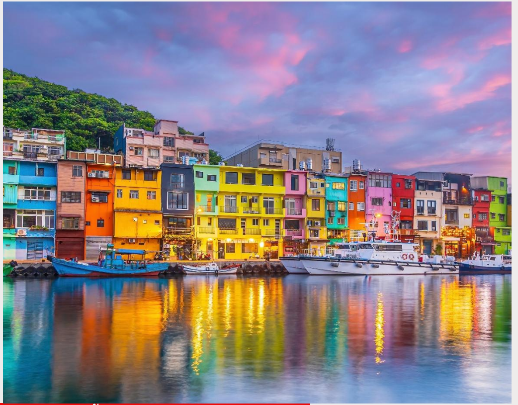
ท่าเรือประมงเจิ้งปิน (Zhengbin Fishing Port)

จากนั้นนำท่านเดินทางสู่ ถนนโบราณจีวเฟิน (Jiufen Old Street) ตั้งอยู่บนเขา ทิวทัศน์ภาพสวยงาม ด้านหลังเป็นภูเขา ด้านหน้าเป็นวิวทะเลจีหลง แต่เดิมเคยเป็นหมู่บ้านเล็กๆ ที่โอบล้อมด้วยทิวเขา และมองเห็นท้องทะเลอยู่ลิบๆ หมู่บ้านแห่งนี้อดีตเคยเป็นเมืองทองคำที่มีชื่อเสียงตั้งแต่สมัยกษัตริย์กวางสวี่ แห่งราชวงศ์ชิง โดยตั้งแต่ช่วงปี ค.ศ. 1890 ได้มีการสำรวจพบแร่ทองคำ ญี่ปุ่นที่เป็นผู้ครอบครองได้หวนขณะนั้น ได้เนรมิตให้ที่นี่เป็นเมืองทอง โดยใช้แรงงานหลักคือเชลยศึก ซึ่งนำมาซึ่งความมั่งคั่งและคึกคักให้กับเมือง แต่เมื่อแร่ทองคำร่อยหรอ จนบริษัทเอกชนของไต้หวันที่มารับช่วงต่อในช่วงปี ค.ศ. 1987 ต้องประสบภาวะขาดทุนจนต้องปิดกิจการไปในที่สุด จนเป็นแรงบันดาลใจให้ผู้สร้างของญี่ปุ่นอย่างสตูดิโอจิบลิ ได้ใช้เป็นฉากหลังของหนังการ์ตูนที่โด่งดังจนคว่ำรางวัลออสการ์มาครองในปี 2002 กับเรื่อง “SPIRIT AWAY” นอกจากนี้ภายในหมู่บ้านที่เต็มไปด้วยอาคารโบราณย้อนยุคอันเป็นเสน่ห์หลักของเมืองนี้ ทั้งสองข้างทาง มีสินค้าขายอยู่มากมาย ไม่ว่าจะเป็น ของที่ระลึก อาหารท้องถิ่น ชุดเสื้อผ้าที่เพ้า ร้านอาหาร เป็นต้น (โดยสารรถประจำทางขึ้นไป)