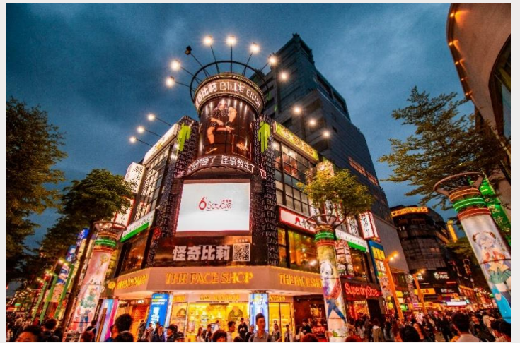
ตลาดกลางคืนซีเหมินติง (Ximending Night Market)

เย็น อิสระอาหารเย็นตามอัธยาศัย ณ ตลาดกลางคืนซีเหมินติง