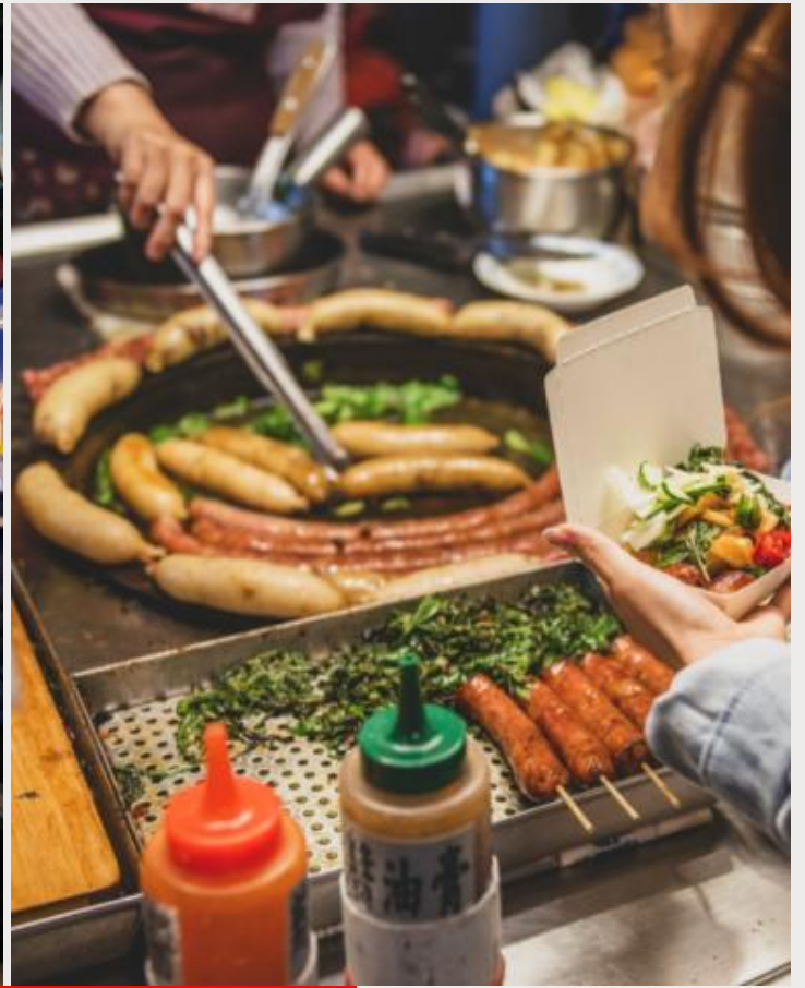
ตลาดกลางคืนหนิงเซี่ย (Ningxia Night Market)