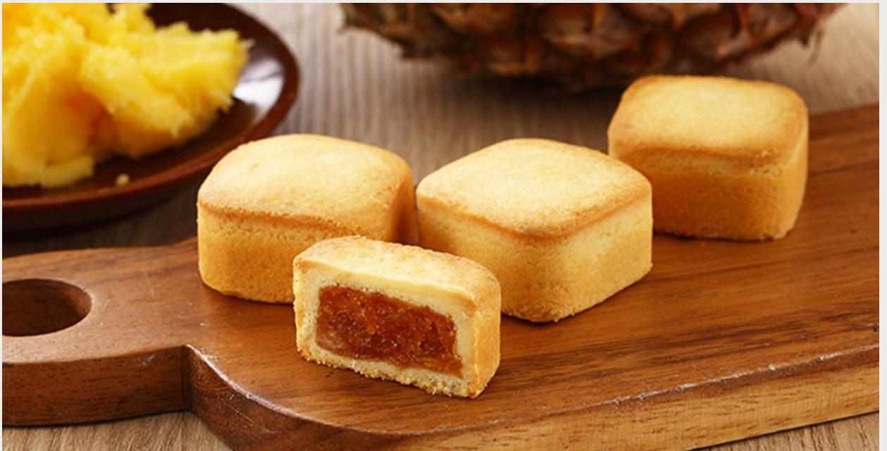
ร้านขนมพายสับปะรด (Taiwanese Pineapple Cake)

นำทุกท่านแวะชิม ร้านขนมพายสับปะรด (Taiwanese Pineapple Cake) ขนมที่ถือได้ว่ามีแหล่งกำเนิดมาจากเกาะไต้หวัน เนื้อแป้งหอมเนยห่อหุ้มแยมสับปะรด รสชาติมีความหวาน และความมันของเนยเล็กน้อย ผสมกับรสเปรี้ยวของสับปะรด ทำให้มีรสชาติที่กลมกล่อมจนเป็นที่นิยม ด้วยรสชาติที่เป็นเอกลักษณ์ไม่เหมือนใคร ทำให้ขนมพายสับปะรดเป็นขนมที่ขึ้นชื่อของเกาะไต้หวัน ไม่ว่าจะใครที่ได้มาเยือนก็ต้องซื้อเป็นของฝากติดมือกลับบ้าน นอกจากขนมพายสับปะรดแล้ว ยังมีขนมอีกมากมายให้เลือกชิม และเลือกซื้อ เช่น ขนมพระอาทิตย์ ขนมพายเผือก เป็นต้น อีสาระให้ทุกท่านเดินเลือกซื้อขนม