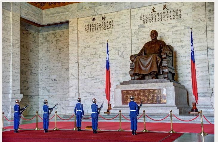
อนุสรณ์สถานเจียงไคเช็ค (Chiang Kai-Shek Memorial Hall)

จากนั้นนำท่านถ่ายรูปกับ ตึกไทเป 101 (Taipei 101) ตึกระฟ้าที่สูงที่สุดในไต้หวัน และเคยเป็นตึกที่สูงที่สุดในโลกในปี ค.ศ. 2004 ความสูงจากพื้นดิน 509.2 เมตร มีทั้งหมด 101 ชั้น ชั้น 1-5 จะเป็น ส่วนของห้องสรรพสินค้าและร้านอาหารต่างๆ โดยมีสินค้ามากมายให้ท่านเลือกซื้อป ทั้งสินค้าทั่วไป