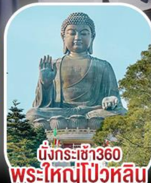
นั่งกระเช้า360 พระใหญ่โป้วหลิน