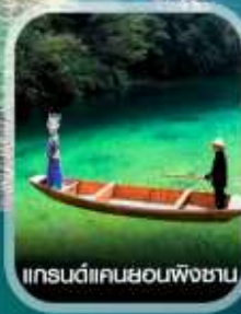
แกรนด์แคนยอนผิงซาน

คอนเฟิร์มออกเดินทาง ทุกพีเรียด 2 ท่านขึ้นไป