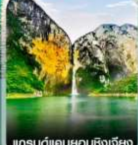
แกรนด์แคนยอนชิงเจียง