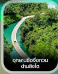
อุทยานซีจื่อถกวน ด่านสิงโต

เช็กอิน เมืองโบราณเซวียนเอน ชมความงามยามค่ำคืน สัมผัสมหัศจรรย์ ถ้ำหลงหลินกง ธารน้ำสีมรกตใสราวกระจก แกรนด์แคนยอนผิงซาน ล่องเรือชมธรรมชาติ แกรนด์แคนยอนชิงเจียง