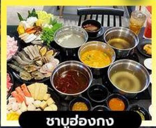
ชาบูฮ่องกง