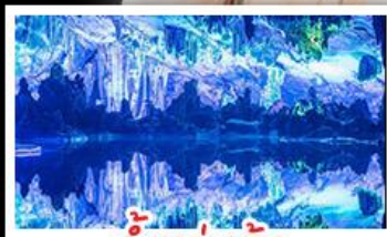
ถ้ำลุ่ม้อ