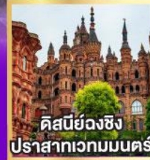
คิสนียองซิง ปราสาทเวทมนตร์