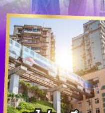
รถไฟฟ้า-สุตึก

เที่ยวเต็มอิ่ม..ไม่ลงร้านช้อปปิ้ง นั่งรถไฟความเร็วสูง 2 เที่ยว ไม่มีออฟชั่นเพิ่ม