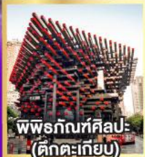
พิพิธภัณฑ์ศิลปะ (ตึกตะเกียบ)