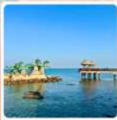
เกาะหย่างหม่า