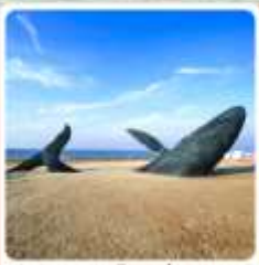
วาฬผู้โดดเดี่ยว