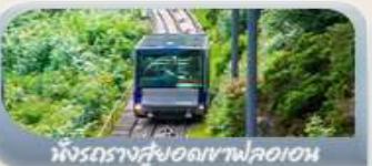
นั่งรถรางสวยอดเขาฟลอมอน