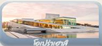
โอปราเฮาส์

11-19 มิ.ย. 69 / 23-31 ก.ค. 69 / 05-13 ส.ค. 69 03-11 ก.ย. 69 / 24 ก.ย.-02 ต.ค.69