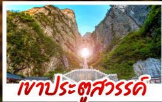
เขาประตูลสวรรค์