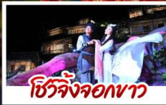
ชิงจิงจอกทาว