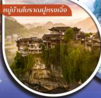
หมู่บ้านโบราณฝูหลงเจี๋ย

คอนเฟิร์มออกเดินทาง 5 วันก่อนขึ้นเครื่อง