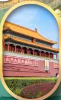
จัสมุติสเทียนอันเหมิน