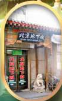
เมืองโบราณใต้ดิน