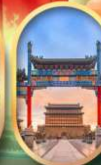
ถนนคนเดินเทียนเหมิน