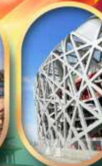
ผ่านชมสนามกีฬาาริงนก