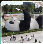
รูปปั้นหมีแพนด้าเซลฟี่

แวะชิมปิ้งย่างหมาล่า ร้านคุณพ่อ (แท้จริง) ที่เมืองเล่อซาน เดินทาง