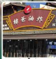
ร้านปิ้งย่าง ของพ่อหวังเหอตี้