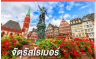
จัตุรัสโรเมอร์