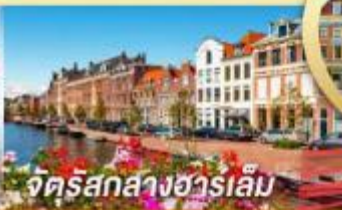
จัตุรัสสากซางฮาร์เล็ม