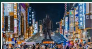
ถนนแดนเดินเซว่งซิงคู่