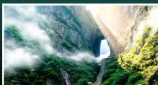
เขาประตูลี้สวรรค์