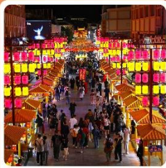
ตลาดกลางคีนซาโจว