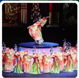
โชว์ FOSHAN QIANGUING