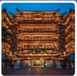
วัดต้าฟือซื่อ