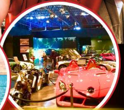
Royal Automobile Museum