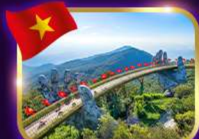
สะพานมือสีทอง บานาฮิลล์