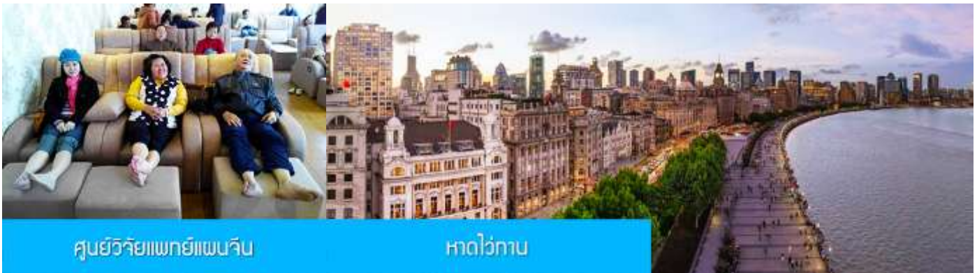
ศูนย์วิจัยแพทยแผนจีน