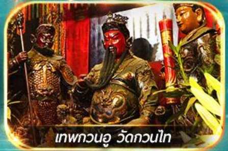
เทพกวนอู วัดกวนไท

พามุไหว้พระ: ขอรพร 8 วัดดัง, อิสระช้อปปิ้ง 1 วันเต็มแบบจุใจ