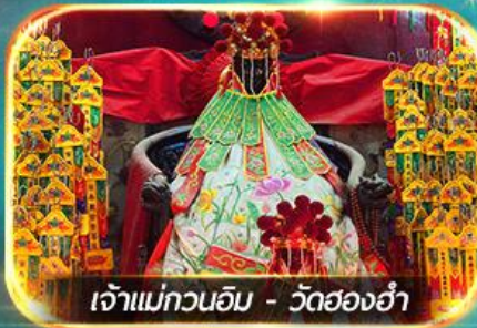
เจ้าแม่กวนอิม - วัดสองฮำ