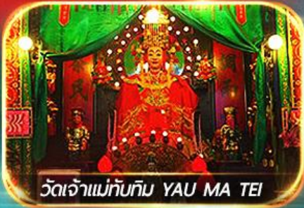
วัดเจ้าแม่ทับทิม YAU MA TEI