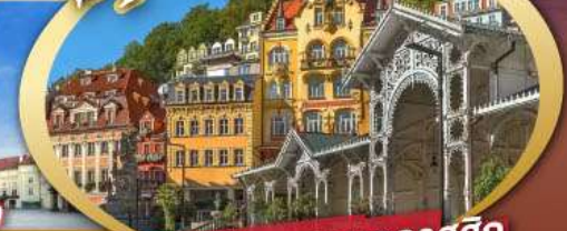
ชมสถาปัตยกรรมคลาสสิก เมือง คาร์โลวี วารี