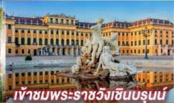
เข้าชมพระราชวังชินบรุนน์