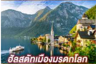
อิลสติกเมืองมรดกโลก