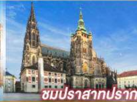
ชมปราสาทปราก