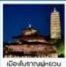
หมู่บ้านเหมียนฮวาฮวาน