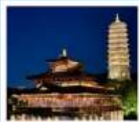
เมืองโบราณผู้หยวน

เมืองโบราณผู้หยวน / ภูเขาหินัวส์วซาน (รวมรถกอล์ฟ) ห้างสรรพสินค้าเต๋อจี / วัดจีหมิง / ทะเลสาบเซวียนอู่ ถนนอุ่งต้าเต้า / อู๋ซีหมู่บ้านเหียนฮวาวาน / เซาหูซิว เชียงใหม่ คลาสสิก ไนท์ / ถนนนานกิง / Tian An 1,000 Trees North Bund Green Land / Florentia Village Outlet