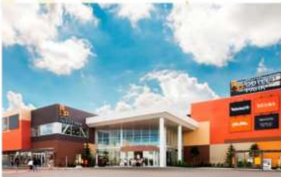
SHOPPING AT KITA HIROSHIMA OUTLET

อิสระอาหารค่ำตามอัธยาศัย (ไม่รวมในรายการ)