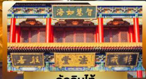
วัดจินไท่