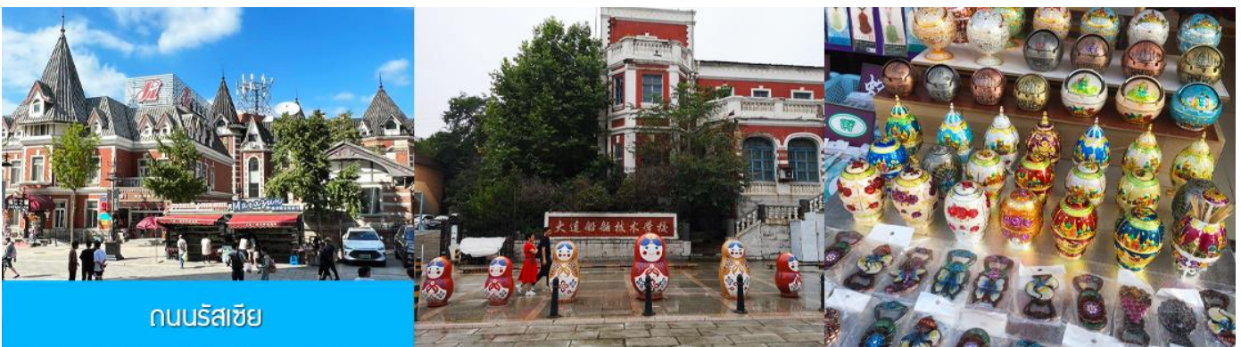
ถนนรัสเซีย

จากนั้นนำท่านขึ้น รถรางไฟฟ้า 有轨电车 เป็นรถรางไฟฟ้าที่สร้างขึ้นในปี ค.ศ. 1909 โดยบริษัทญี่ปุ่น (เมืองต้าเหลียนเคยตกเป็นเมืองขึ้นของญี่ปุ่นในปีค.ศ. 1900 – 1945 ) นำท่านนั่งรถรางโบราณผ่านชมตัวเมืองต้าเหลียน หนึ่งในเมืองแรก ๆ ที่มีบริการรถรางไฟฟ้าเปิดให้บริการในเขตเมือง ปัจจุบันมีเพียงสายที่ยังเปิดให้บริการในเมืองต้าเหลียน.