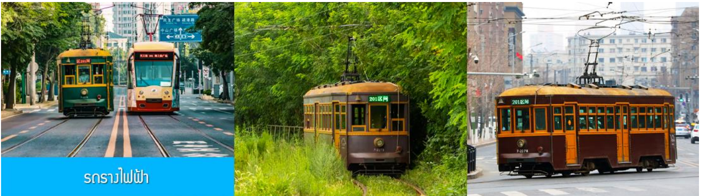
รถรางไฟฟ้า