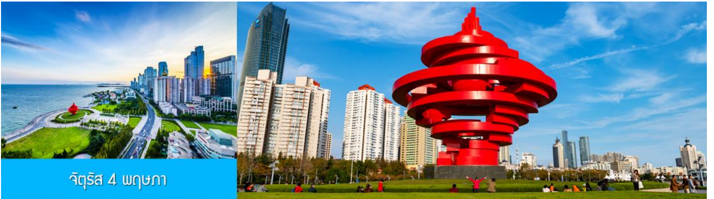
จัตุรัส 4 พฤษภาคม

จากนั้นนำท่านเที่ยวชม โรงเบียร์ชิงเต่า 青岛啤酒博物馆 พิพิธภัณฑ์เบียร์ที่ขึ้นชื่อของเมืองชิงเต่า ซึ่งเป็นเบียร์ยี่ห้อแรกที่ผลิตขึ้นในประเทศจีน ชมเบียร์ คอลเลกชั่นที่มียี่ห้อหลากหลายที่สุดของโลก และชมการจัดแสดงภาพและวิดิทัศน์เกี่ยวกับวิวัฒนาการของเบียร์ ขั้นตอนการผลิตและอื่น ๆ ที่เกี่ยวข้อง พร้อมชิมเบียร์ชิงเต่า ซึ่งเป็นเบียร์ที่ขายดีที่สุดในยี่ห้อหนึ่งของจีน.. (ชิมเบียร์ชิงเต่าท่านละ 1 แก้ว รับกลับอีก 1 ขวดเล็ก ตอนเดินออก)