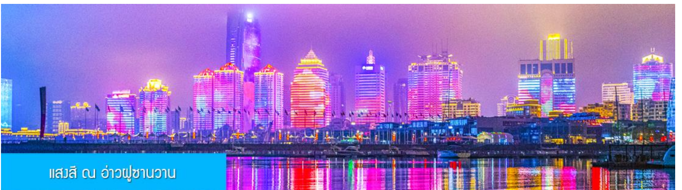
แอสสิ ณ อ่าวฟู่ซานวาว

ค่ำ รับประทานอาหารค่ำ ณ ภัตตาคาร *เมนูซีฟู้ด (3)