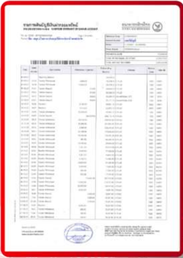
ตัวอย่าง Bank Guarantee ที่ผู้สมัครต้องยื่นธนาคาร