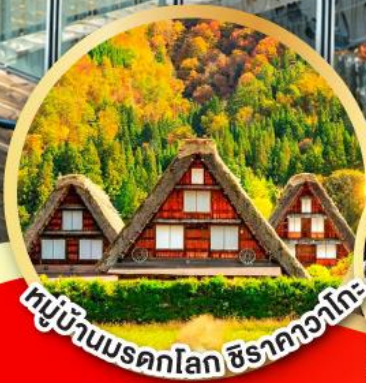
หมู่บ้านมรดกโลก ชิราคาวาโกะ