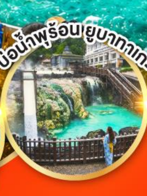
เขื่อนน้ำพุร้อนยูบาคาเกะ