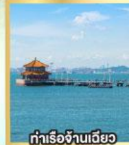
กำเรือจันทันเฉียว