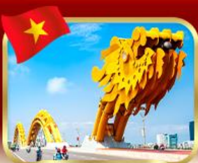
สะพานมังกร ดานัง