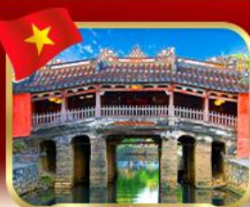
สะพานญี่ปุ่นโบราณ