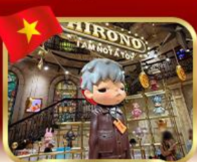
popmart บานาฮิลล์