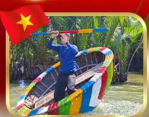
ล่องเรือกระดังที่มณฑล