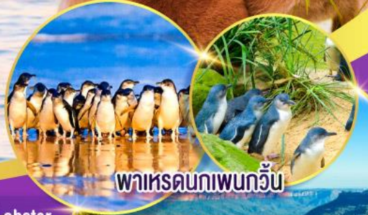
พาเหรดนกเพนกวิน

ล่องเรือชมอ่าวซิดนีย์พร้อมรับประทานอาหารกลางวัน และเข้าชมสวนสัตว์ทารองก้า