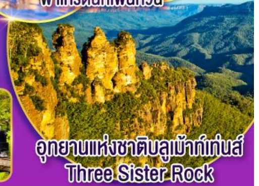
อุทยานแห่งชาติบลูเมาท์เทนส์ Three Sister Rock