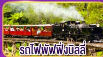
รถไฟพัพฟิงบิลลี่