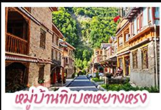
หมู่บ้านทิเบตทางตรง

ตะลุยเจียงตู คูหิมะต้ากู่ปิงชาน ชมเช็กอินแพนด้ายักษ์ พักใจที่หยดน้ำด้าสิฟ้า! แวะชิลเมืองโบราณลั่วไต้ สัมผัสลมเต๋สั่นท์ หมู่บ้านทิเบตทางหลวงฮาต้อ สัมผัสความหนาวเย็นที่ อุกยาบสวรรค์ธารน้ำแข็งต้ากู่ปิงชาน แหล่งรวมวิวหลักล้าน ตื่นตาไปกับแสงสียามค่ำคั่น หยดน้ำด้าสิฟ้า ณ สะพานทามเฉียว เมืองดูเจียงเยี่ยน ก่อนปิดท้ายด้วยการช้อปปิ้งจุใจ ถนนช้อปปิ้ง-ไถ่กู่หลี่ และอะภาทักแพนด้าเซลฟี่ สุดคิว!