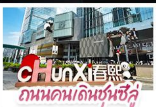
ถนนคนเดินชุนชีลู่