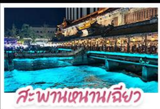
สะพานเสนาหนเฉียว