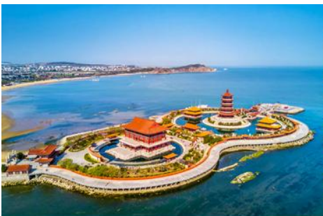
อุทยานท่องเที่ยวเปิดเขินข้ามทะเล

เที่ยง รับประทานอาหารกลางวัน ณ ภัตตาคาร (5)