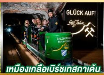
เหมืองเกลือเบิร์ชเทสกาเดิน