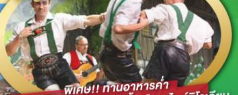
พิเศษ!! ทานอาหารค่ำ พร้อมชมการแสดงดนตรีพื้นเมืองสไตร์ทิวลิป และเยือนเมืองอูเทรคต์ สีสันใหม่เนเธอร์แลนด์