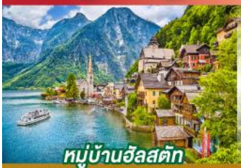
หมู่บ้านอัลสตัด