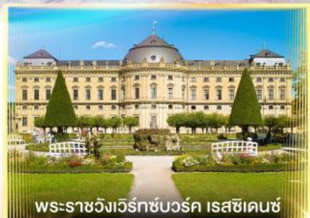
พระราชวังแวร์ทซ์บวร์ค เรสซิเดนซ์