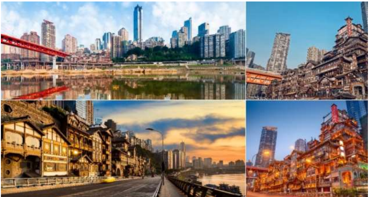
อิสระอาหารค่ำ ตามอภิยาตย์