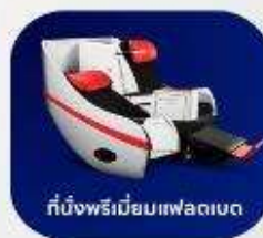
ที่นั่งพรีเมียมแพลนเน็ต