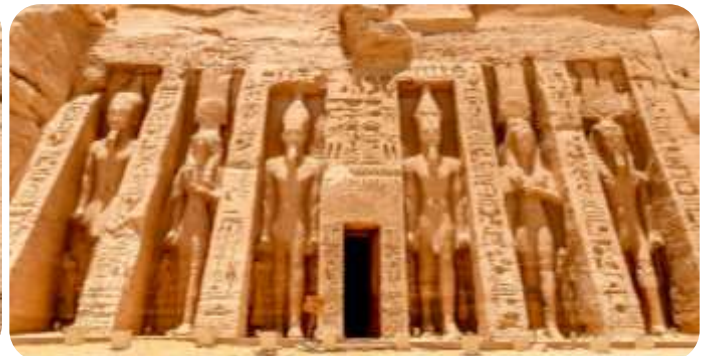
สมควรแก่เวลานำท่านเดินทางกลับเมืองอัสวาน