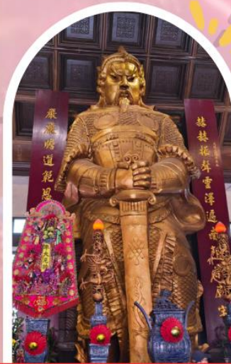
วัดเซกวง ขอพรโชคลาภ การเงิน และธุรกิจ