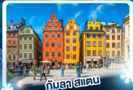
กับลาสแดน